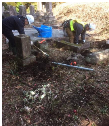
お彼岸直前 お墓起こし