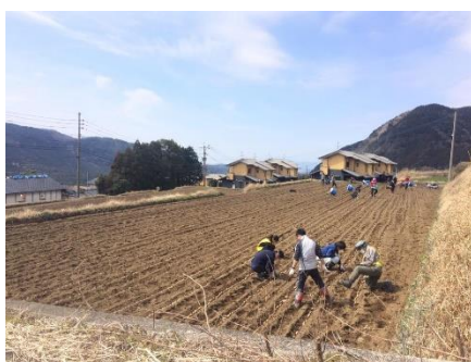
全国へ届け たすけ藍てぬぐい