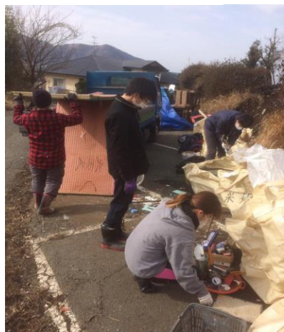
解体前の引っ越し手伝い