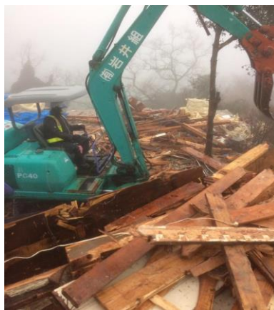
解体もお手伝いします