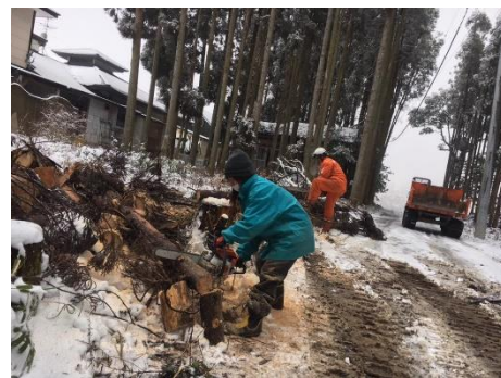
火の鳥温泉復興が始動